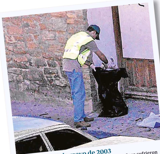
Sangüesa, 30 de mayo de 2003 Dos policías nacionales que hacían DNI en Sangüesa sufrieron el último atentado cometido por ETA en la Comunidad Foral