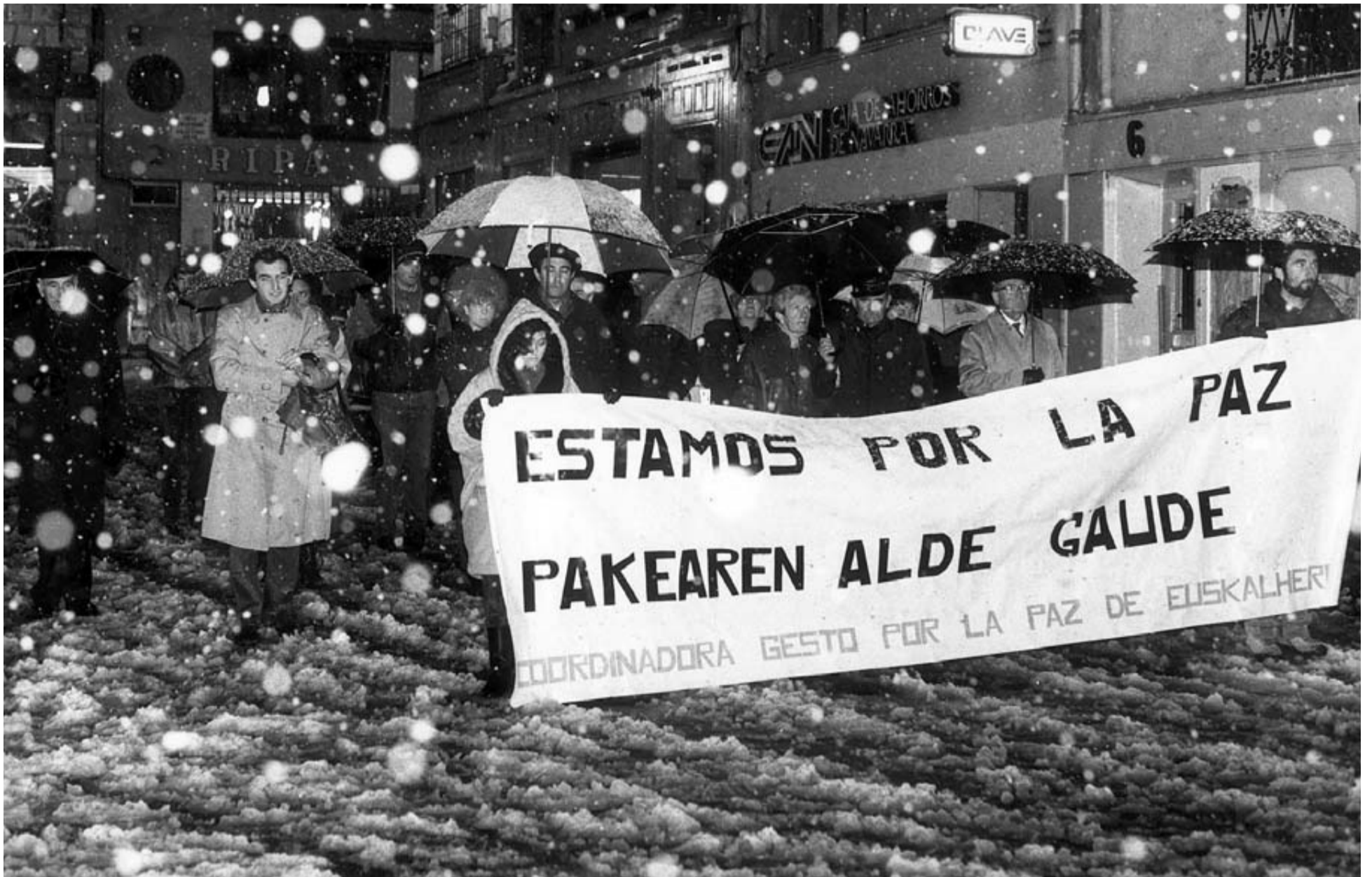
CONCENTRACIÓN DE GESTO POR LA PAZ POR EL ASESINATO DE SEIS POLICÍAS NACIONALES EN SABADELL. Imagen de la Plaza Consistorial de Pamplona, el 9 de diciembre de 1990, bajo una copiosa nevada. La imagen aparece en el quinto capítulo del libro, dedicado a la respuesta social contra la banda terrorista.